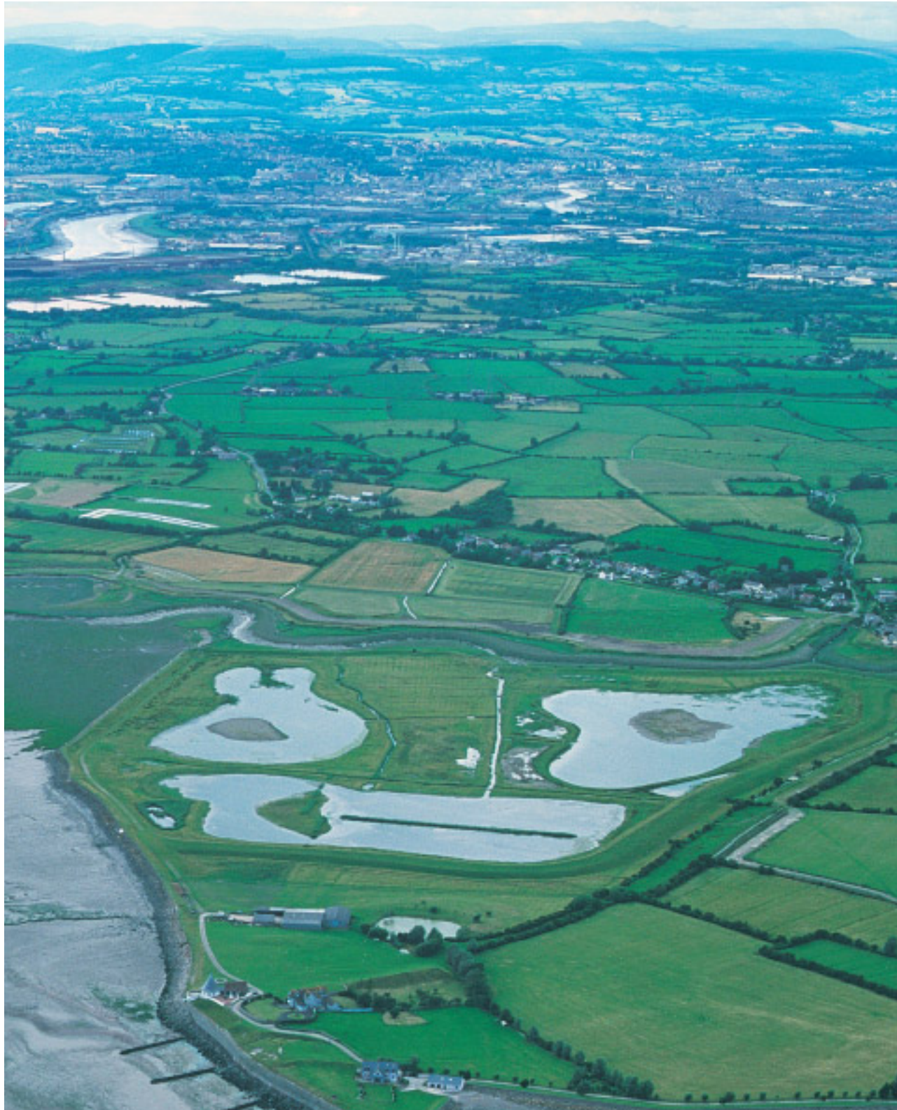
Llun o'r awyr o forlynoedd a chorsleoedd Gwarchodfa Gwlyptiroedd Gwastadeddau Gwent a grëwyd yn lle'r cynefinoedd a gollwyd pan adeiladwyd Morglawdd Bae Caerdydd. Mae'r warchodfa wedi'i hintegreiddio'n llwyddiannus ym mhatrwm tirwedd hanesyddol Gwastadeddau Gwent.