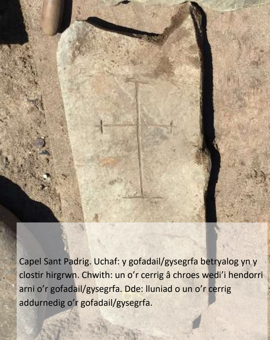
Capel Sant Padrig. Uchaf: y gofadail/gysegrfa betryalog yn y clostir hirgrwn. Chwith: un o'r cerrig â chroes wedi'i hendorri arni o'r gofadail/gysegrfa. Dde: lluniad o un o'r cerrig addurnedig o'r gofadail/gysegrfa.