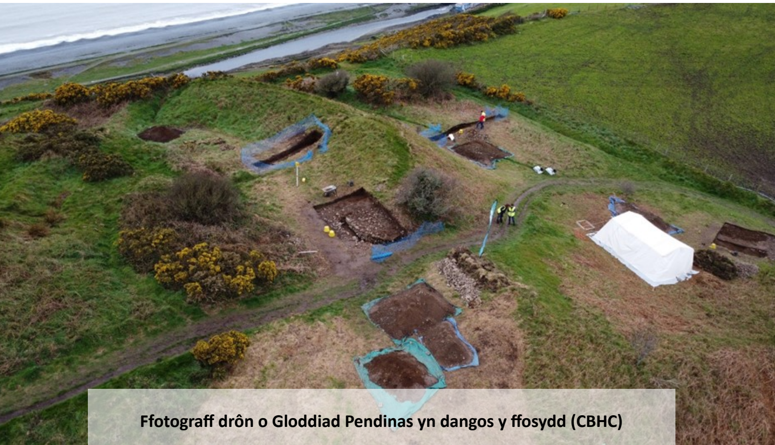
Ffotograff drôn o Gloddiad Pendinas yn dangos y ffosydd

Cynhaliwyd y gwaith cloddio cyntaf am gyfnod o bedair wythnos o 27 Mawrth i 21 Ebrill 2023. Cloddiwyd pedair ffos, mewn rhai achosion, ochr yn ochr â mynd ati'n rhannol i ailgloddio ffosydd a gloddiwyd gan Daryl Forde yn y 1930au. Un o brif amcanion y gwaith oedd cael tystiolaeth wyddonol ar gyfer dyddio gweddillion er mwyn gallu dyddio rhai o'r gweddillion cymhleth a archwiliwyd yn y 1930au.