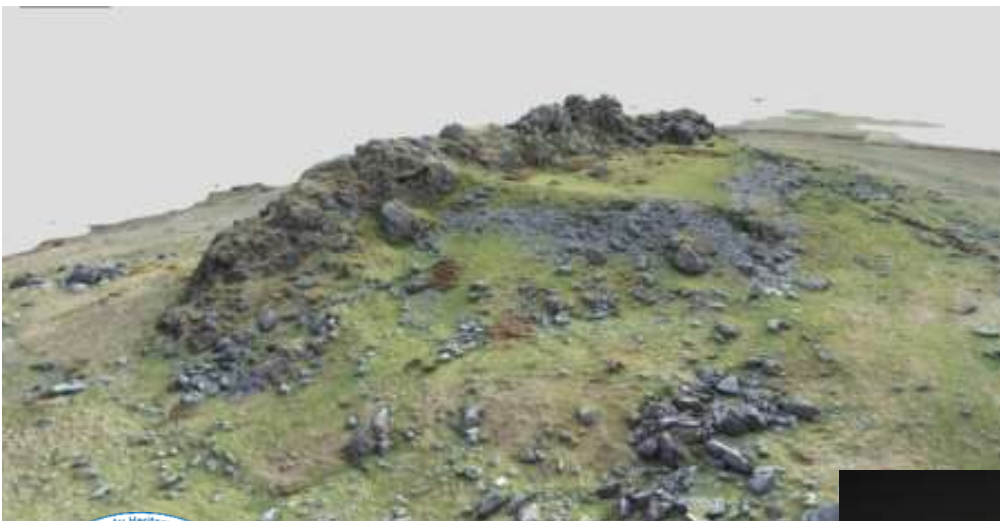
Chwith: Delwedd o fodel 3D o Fryngaer Carn Alw yn y Preseli, a grëwyd o luniau drôn

Buom yn cynhyrchu modelau digidol 3D o amryw safleoedd archaeolegol yn y Preseli a Mynyddoedd Cambria, gan gynnwys brigadau, bryngaerau, a chrugiau o'r Oes Efydd ar hyd Crib y Preseli (Yr Heol Aur). Bu'r Ymddiriedolaeth wrthi hefyd yn digideiddio arteffactau a leolir mewn amryw amgueddfeydd, er enghraifft, wrn amlosgi o grug Croesmihangel a leolir bellach yn Amgueddfa Dinbych-y-pysgod. Rydym wedi ymwneud â chreu a chynnal gweithgareddau yng nghyswllt gwyddoniaeth y dinesydd gan ddefnyddio LiDAR a gwirio yn y maes ('ground truthing') ar gyfer digwyddiadau cymunedol, a chyflwynwyd sgysiau wyneb yn wyneb ac ar-lein yn Amgueddfa Dinbych-y-pysgod, neuadd gymuned Maenclochog, ac yn ystod Diwrnod Archaeoleg Sir Gaerfyrddin. Buom yn cynghori ynghylch gwaith ailadeiladu ym mwyngloddiau Cwmystwyth ac ym mryngaer Castell Rhyfel yng Ngheredigion a bryngaer Foel Drygarn yn y Preseli. Yn ogystal â hyn, gwnaed gwaith cynllunio at y dyfodol ar gyfer cynnal arolygon geoffisegol cymunedol, gwaith gwirio yn y maes, y posibilrwydd o gofnodi mynwentydd, ynghyd â gwaith ailadeiladu/ digidol yn yr ardaloedd ffocws.