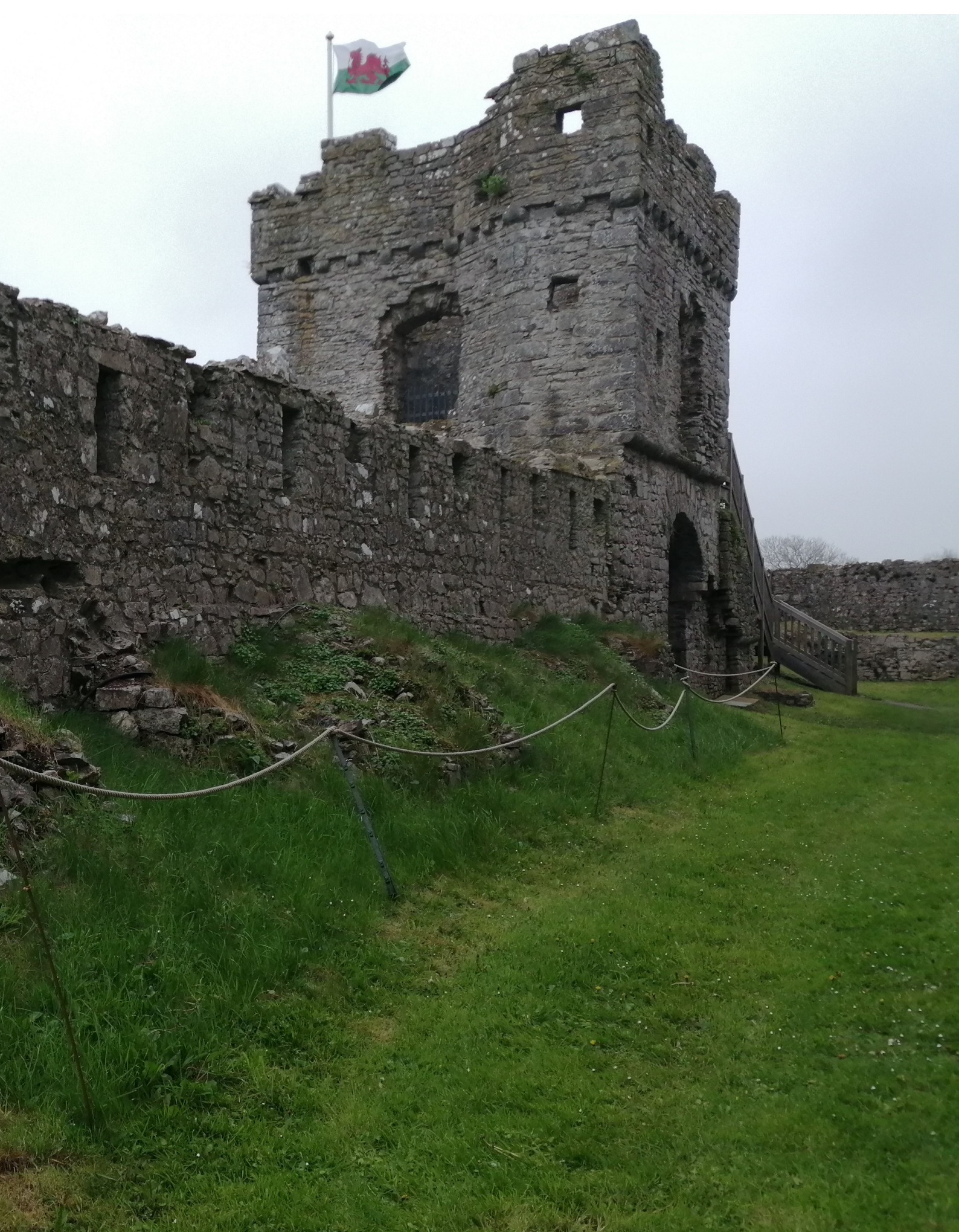
Ymweliad safle Castell Caeriw